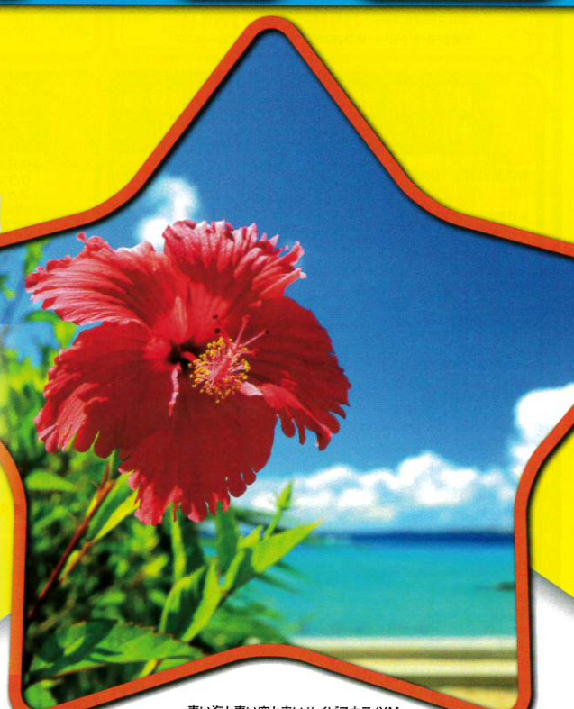
青い海と青い空と赤いハイビスカス/XM